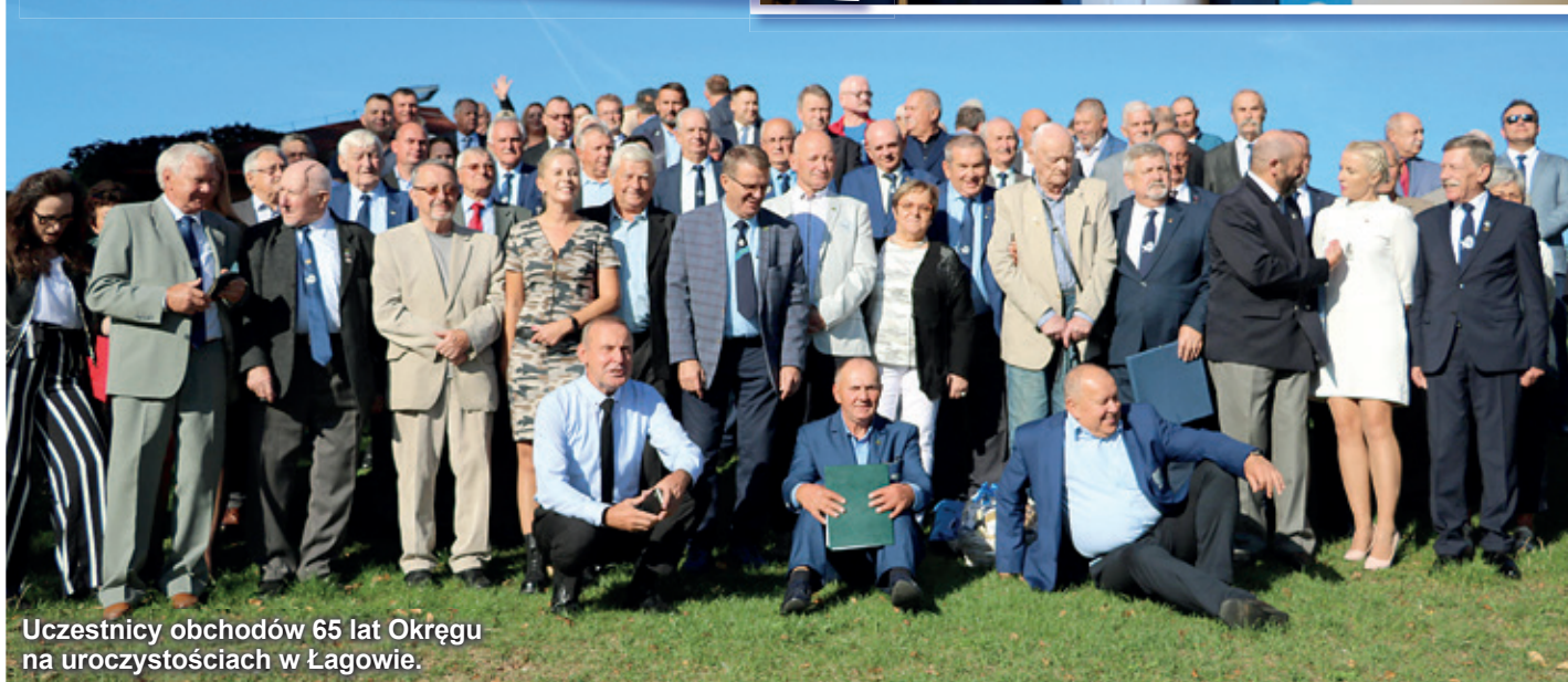
Uczestnicy obchodów 65 lat Okręgu na uroczystościach w Łągowie.