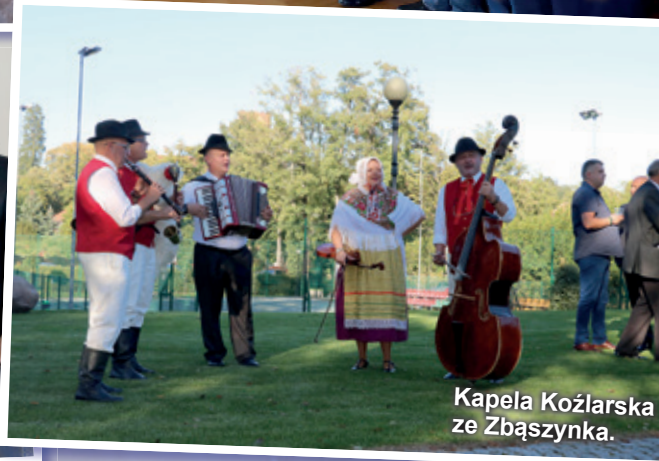
Kapela Kozłarska ze Zbąszynka.