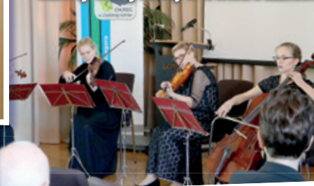
Kwartet smyczkowy Państwowej Szkoły Muzycznej w Świebodzinie.