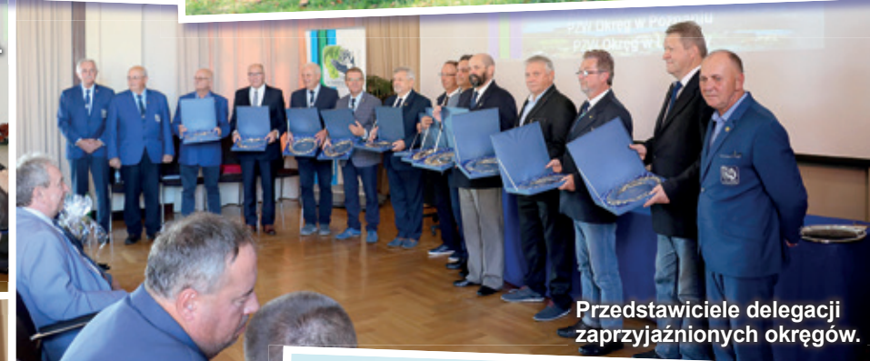
Przedstawiciele delegacji zaprzyjaźnionych okręgów.