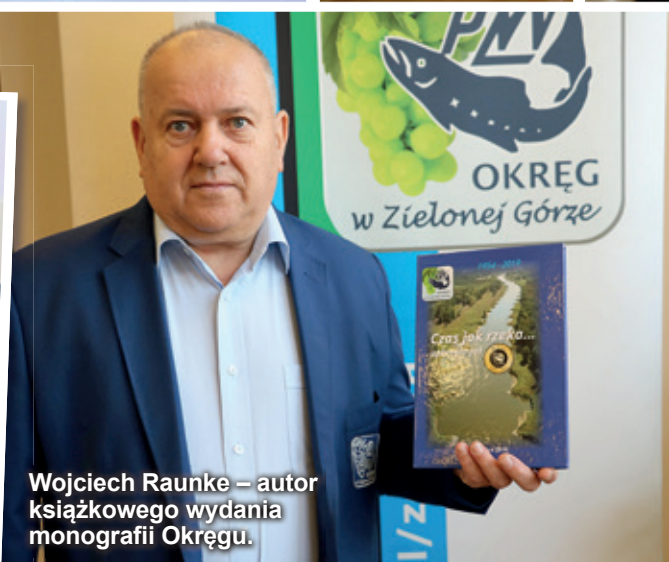
Wojciech Raunke – autor książkowego wydania monografii Okręgu.