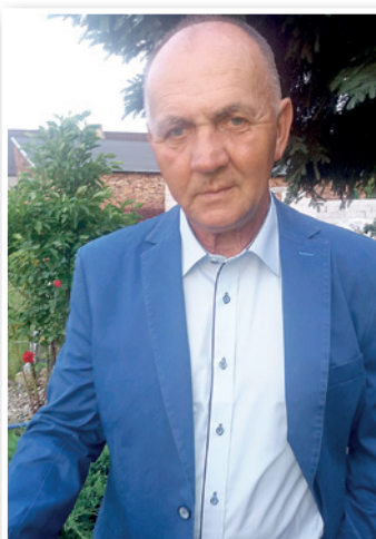
Prezes Zarządu Okręgu PZW w Zielonej Górze

Z życzeniami przysłowiowego „Połamania kija na rybie”